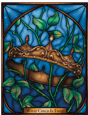
Illustration de la couverture par Amelia Hatzitolios

Dans Quel est l'enfant ? nous voyons Dieu à l'œuvre en notre faveur, venant à nous sous une forme humaine, entrant dans notre monde en tant qu'enfant, serviteur et roi conquérant. C'est une histoire d'amour qui dure depuis toujours, et nous sommes ceux – perdus et indignes – pour qui Dieu a envoyé son Fils.